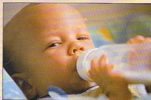
Meniño tomando un biberón de leite.

Ó redor dos seis meses incorpóranse por primeira vez alimentos de sabor salgado, coma os purés de verduras, na dieta dos bebés.