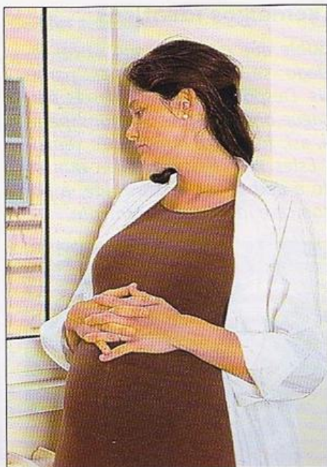
Muller embarazada. Durante o embarazo, o bebé medra e desenvólvese dentro da barriga da nai.