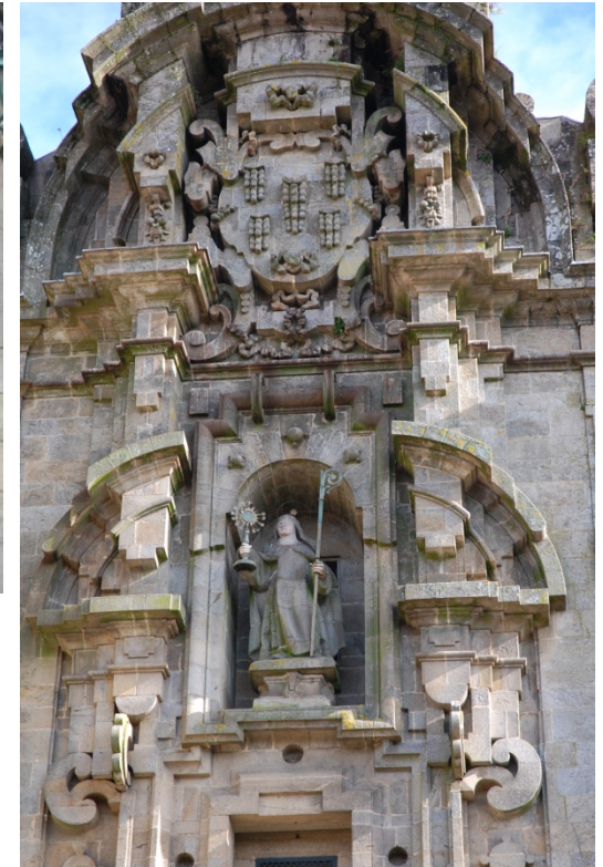
3. Barro de Placas de Placas.