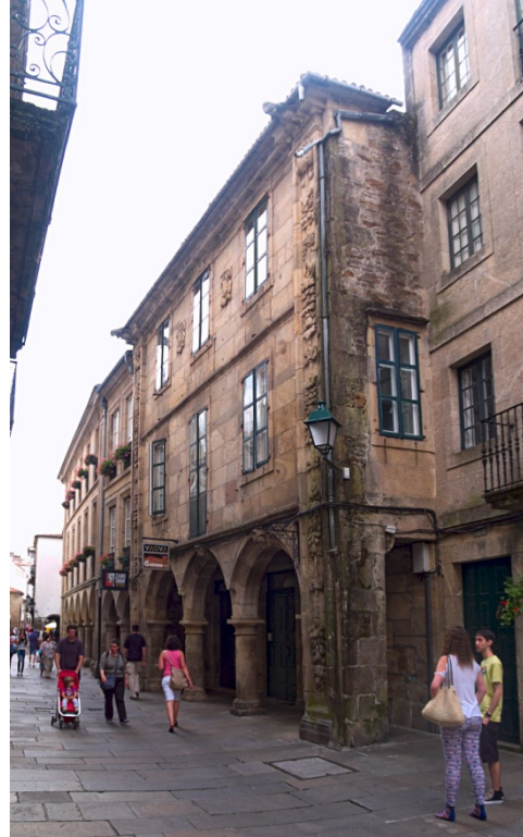
Casa das Pomas.