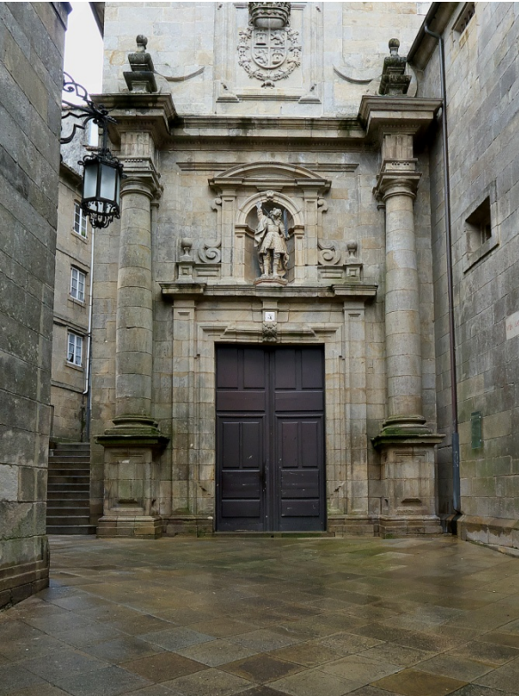
1. Barroco Clasicista