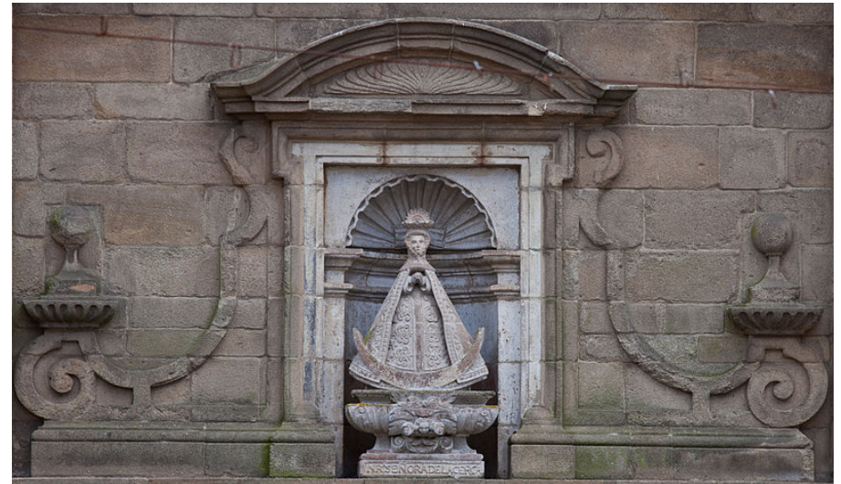
Nuestra Señora de la Cerca.