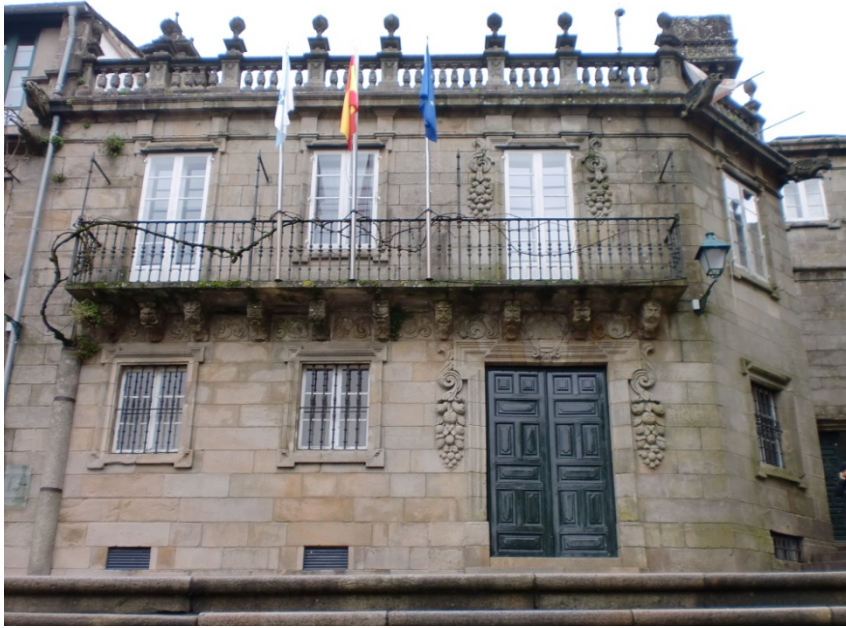
Casa da Parra.