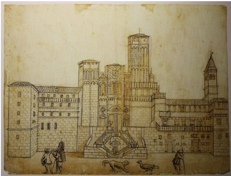
Plaza do Obradoiro en 1657. Vega y Verdugo