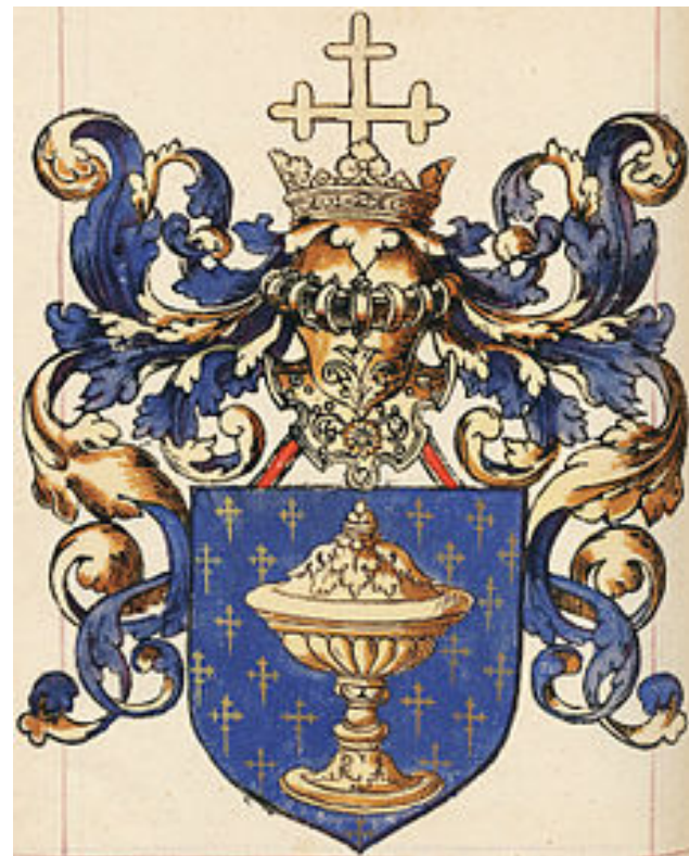
Escudo do reino de Galicia ilustrado no L'armorial Le Blancq. Bibliothèque nationale de France. 1560.