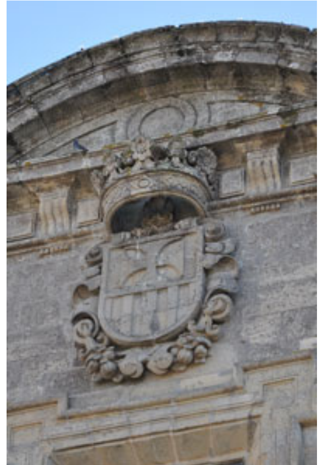
Escudo da Orde Mercedaria