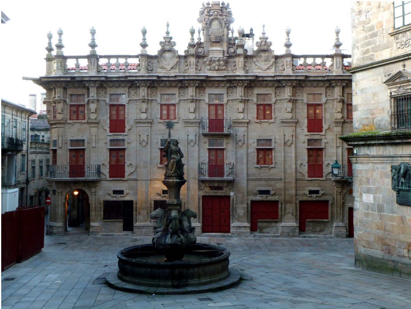
CASA DO CABILDO. Clemente Fernández Sarela.1758