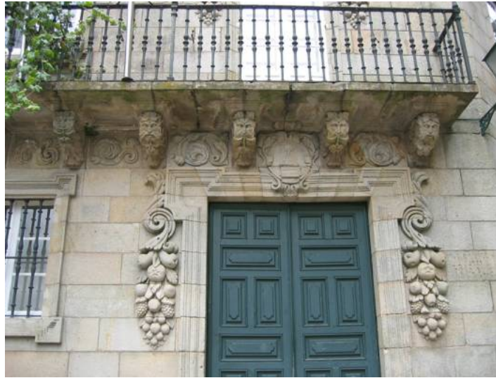
2. Fase naturalista-vegetal ou escola de Domingo de Andrade.