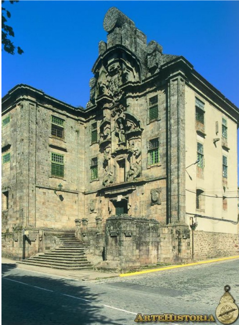
FACHADA TELÓN DE SANTA CLARA. Simón Rodríguez. 1719.