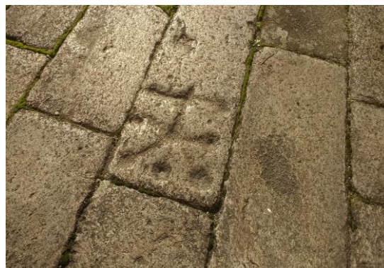
Taboleiro en San Martiño Pinarío

A "petrificación" urbanística levada a cabo durante o esplendor barroco foi o que permitiu a conservación desta manifestación popular, os taboleiros de xogo, nunha especie de fosilización na pedra dunha actividade máis da vida cotiá dos habitantes de Compostela.