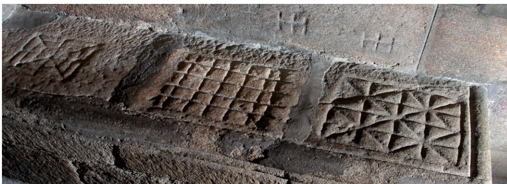
Taboleiros medievais na catedral de San Martiño de Ourense

O famoso Libro dos xogos de Alfonso X do século XIII describe con detalle as regras destes pasatempos durante o Medievo e as súas tres variedades principais: o alquerque de tres (tres en raia), de nove (coñecido tamén como xogo do muíño, triplo recinto ou danza dos nove homes) e de doce . Neste período os taboleiros aparecen asociados ás grandes edificacións relixiosas medievais (en Galiza hai alquerques de IX na catedral de Ourense e Tui, nas igrexas de Gomariz, Santa María de Anxeriz, San Xurxo de Touza, San Salvador de Poio, etc.) ou nos castelos e fortificacións medievais (Castelo da Rocha de Santiago, Monte Lobeira en Vilanova de Arousa, Raíña Loba no Concello dos Blancos, Torres do Oeste en Catoira, etc).