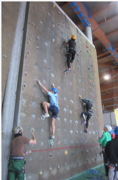
Actividade física regular