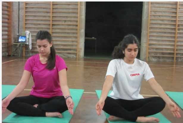
Xestión do estrés