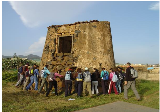
Abrazo al molino de Llano del Moro, de camino a Candelaria.

En esta línea de reflexión es importante el papel que pueden desempeñar las universidades, en sus múltiples facetas de investigación, formación, extensión universitaria, e incluso, sensibilización. La Universidad de La Laguna en Canarias está comprometida desde hace más de una década, a través de la actuación de su Aula de Turismo Cultural, en la promoción de los itinerarios temáticos y en el desarrollo de metodologías para su realización, en la formación de guías-intérpretes, así como en la producción y difusión de materiales didácticos de calidad. Asimismo ha favorecido la conexión de ésta con otras actividades de valorización del potencial endógeno, en el marco del diseño de estrategias de desarrollo territorial y el acercamiento de todas sus posibilidades al conjunto de la sociedad. Pero también se constata en nuestra región que cada vez más entidades públicas y privadas propician la promoción de este forma de practicar las actividades senderistas, a veces con fines empresariales estrechamente vinculados con las premisas del desarrollo local, evidenciadas, sobre todo, en las iniciativas originales que se han ido consolidando en algunos de los ámbitos naturales y rurales más relevantes de las Islas.