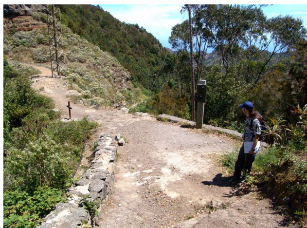
Lugar de parada y descanso en Carboneras (Anaga).

Teniendo en cuenta todos estos factores, establecimos una serie de adaptaciones que definen este nuevo concepto de material de apoyo asociado a un sendero o a cualquier ruta distinta a un itinerario interpretativo: