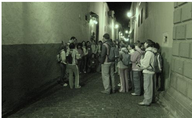
Dialogando con el camino y la calle real, de paso hacia Candelaria.

ciudades junto a la educación ambiental. Dicho evento se ha llevado a cabo en el marco del proyecto que pretende convertir el municipio teguestero en el referente de las actividades senderistas en Tenerife, y asimismo, coincide con la realización de un curso monográfico sobre alguna dimensión del senderismo temático, siendo su última propuesta ahondar en el conocimiento de las metodologías para la recuperación y tematización de caminos tradicionales. En esta ocasión además coincidió con la celebración de las jornadas estatales de senderismo, que impulsa la Federación Española de Deportes de Montaña y Escalada en colaboración con la Federación Canaria de Montañismo, así como con un campo de trabajo juvenil sobre recuperación de tradiciones populares aprovechando las posibilidades del senderismo temático.