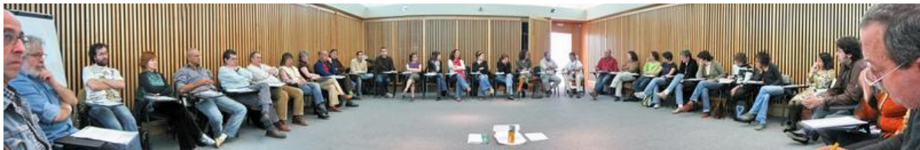
Participantes en la Asamblea de la AIP.

interés de gente joven, nueva, con ganas de implicarse y responder; con ganas de juntarse y trabajar en las distintas tareas de la Asociación. Por si usted no lo sabe, la Asociación no ofrece tantos beneficios a la persona asociada. Asociarse no es sinónimo de ser guía-intérprete, diseñador-intérprete, planificador-intérprete, formador-intérprete o especialista-intérprete. Quien se asocia se compromete a colaborar en mayor o menor medida por los fines colectivos de la Asociación. Nada más.