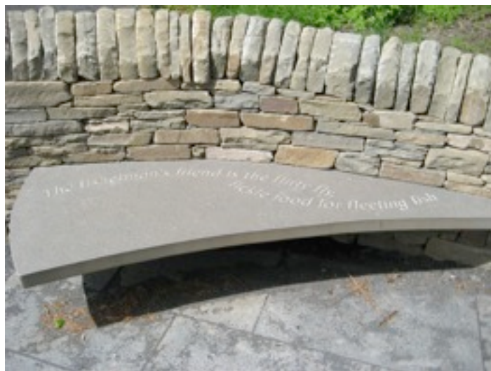
Banco de piedra en el Loch Leven Heritage Trail, con el siguiente texto de Michael: “La coqueta mosca es la amiga del pescador, voluble alimento para el pez fugaz”.

Los artistas ¿satisfacen las necesidades de sus clientes, o satisfacen primero sus propias necesidades creativas, y luego esperan que a los clientes reales o potenciales les guste lo que han hecho? Creo que este último caso es el habitual. ¿Un intérprete puede ser un artista? Es decir, ¿la interpretación puede ser un arte que satisfaga en primer lugar al intérprete, cuando su función principal es satisfacer las necesidades de la audiencia? ¿Los artesanos no usan también la imaginación y la creatividad? ¿Son también artistas los artesanos?