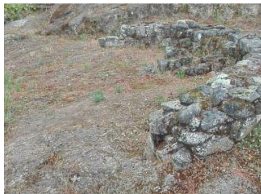
Vivenda con fogar

No xacemento do Castro se atopan edificacións de planta circular e cun vestíbulo semicircular que podería estar aberto ou cerrado, e algunha rectangular. A maioría non se sabe se eran vivendas ou almacéns, o modo de asegurar que unha edificación era vivenda era se se atopaba o fogar no seu interior.