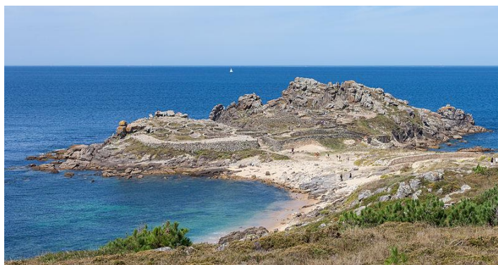
2014 Baroña. Castro de Baroña. Porto do Son-2, Luis Miguel Bugallo Sánchez en Wikipedia CC BY-SA 4.0 .

Os castros son uns recintos fortificados situados en promontorios costeiros ou interiores e provistos de murallas, foxos e/ou terrapléns. Son de tamaño reducido (xeralmente) e están próximos entre si.