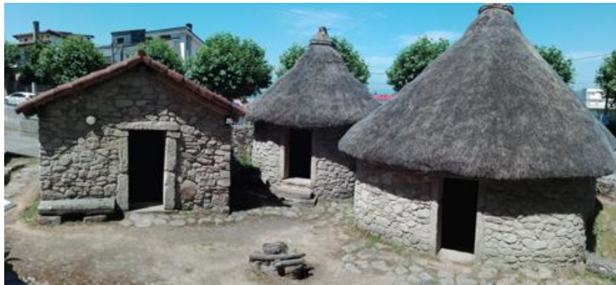
Reconstrución dunha unidade familiar

Na imaxe seguinte pódese ver a reconstrución dunha unidade familiar que se fixo neste castro. A da esquerda sería unha vivenda de planta rectangular, a da dereita sería unha vivenda de planta circular e a do medio sería o almacén. As características que teñen estas edificacións son as expostas no epígrafe 3.