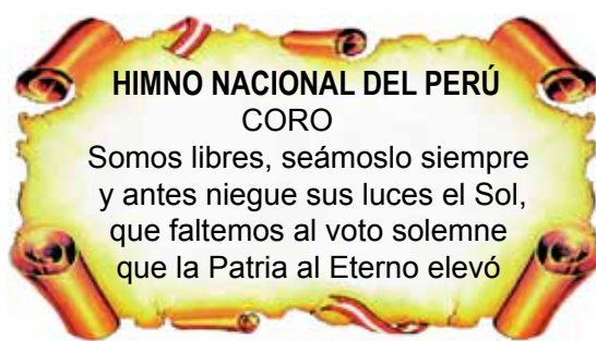
CORO DEL HIMNO NACIONAL