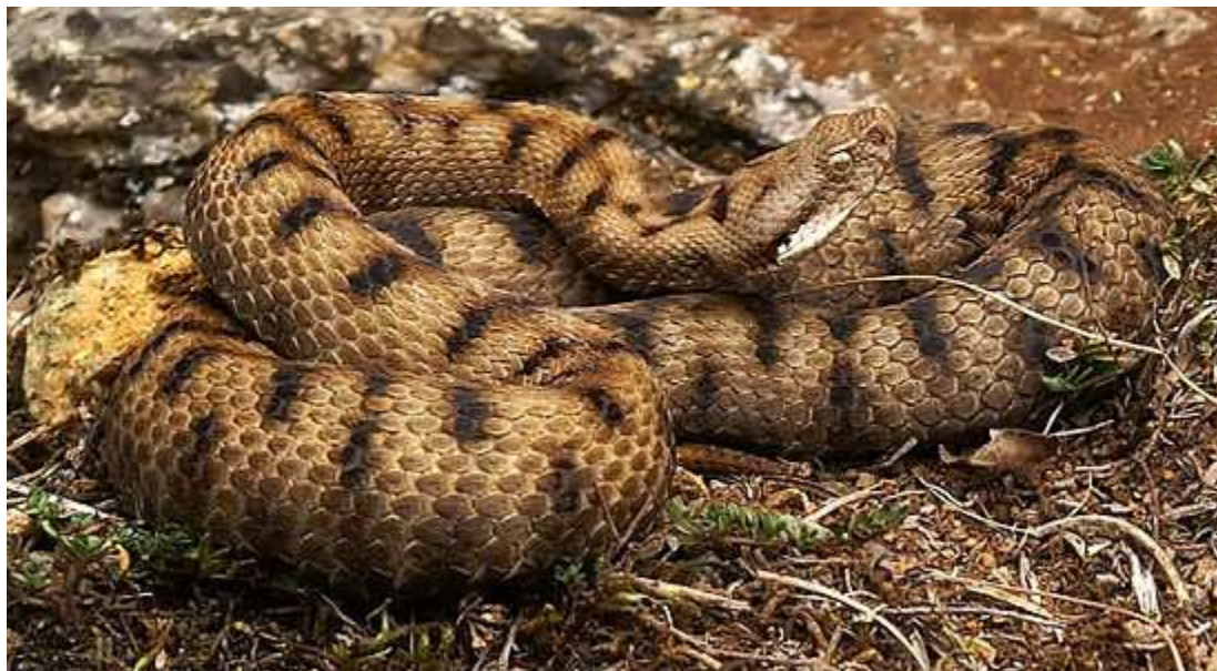
Vipera aspis Víbora áspid. No sur de Galicia