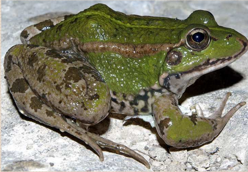
Pelophylax perezi Rana común Ra Pode vivir en augas moi porcas