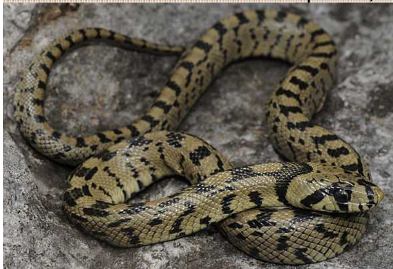
Elaphe scalaris Culebra de escalera. Cobra de escada Xuvenil á esquerda, adulta á direita