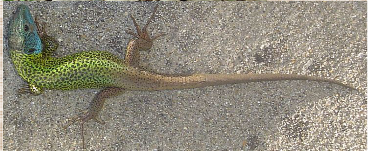
Lacerta schreiberi Lagarto verdinegro/ Lagarto das silveiras