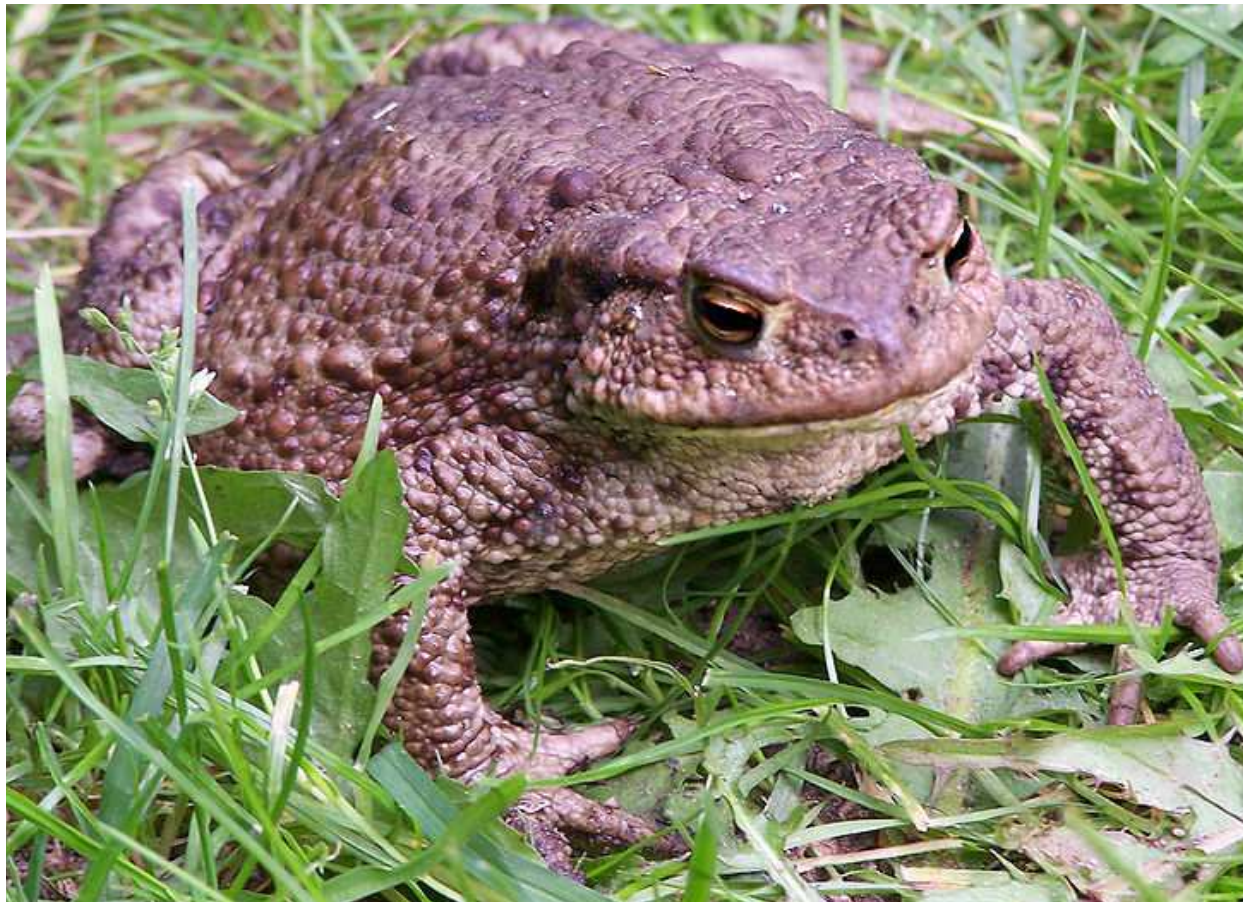
Bufo bufo Sapo común É o anfibio máis grande e o que máis aguanta lonxe da auga