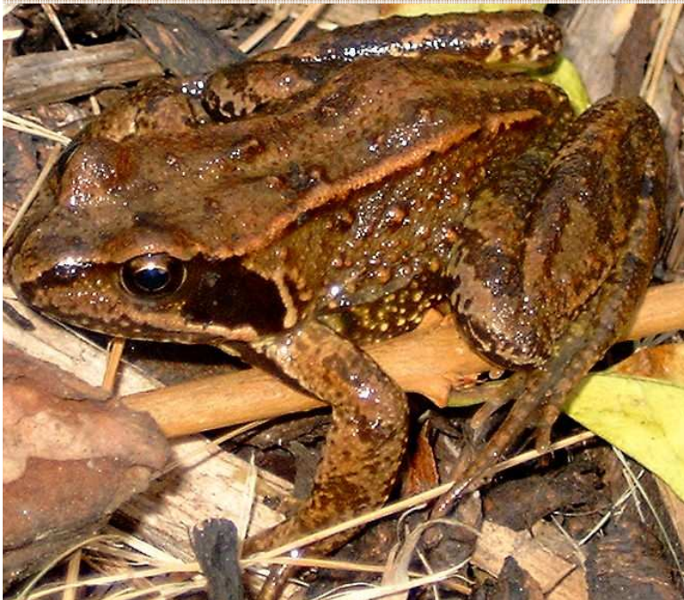
Rana temporaria Rana bermeja