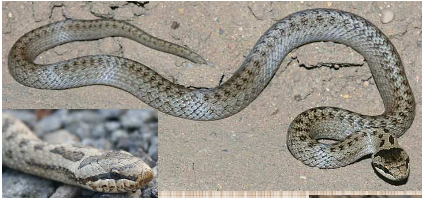
Coronella austriaca Culebra lisa europea