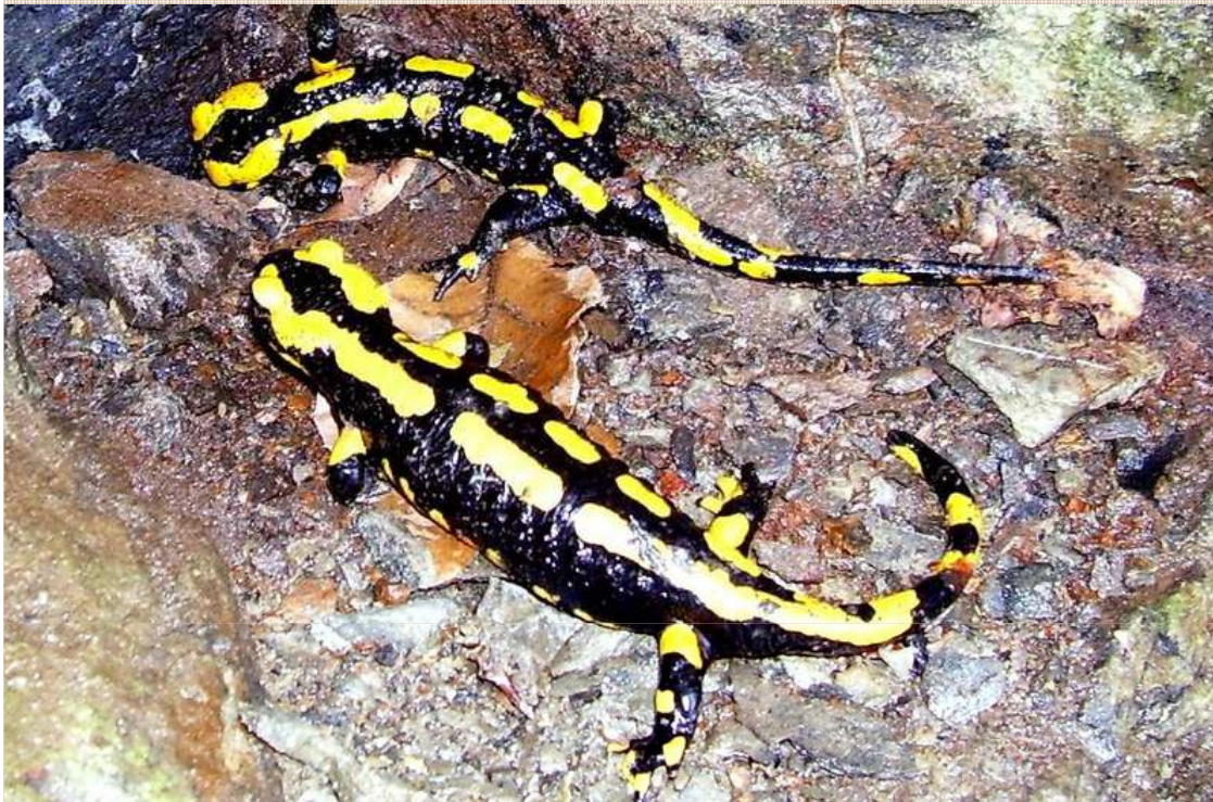
Salamandra salamandra Salamandra común Píntega ou pesoia As tonalidades negras e amarelas son moi variables