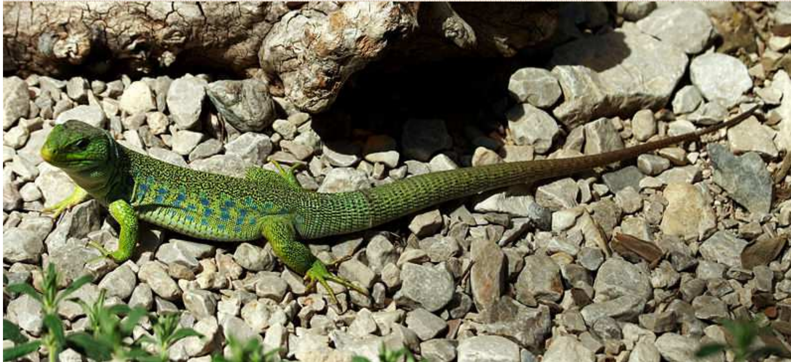
Lacerta lepida Lagarto ocelado Lagarto arnal