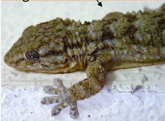
Tarentola mauritanica Salamanquesa común Osga