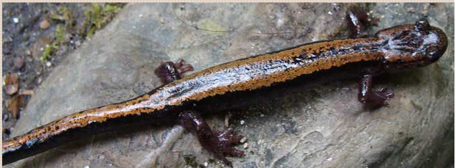
Chioglossa lusitanica Salamandra rabilarga Salamántiga galega É unha especie endémica