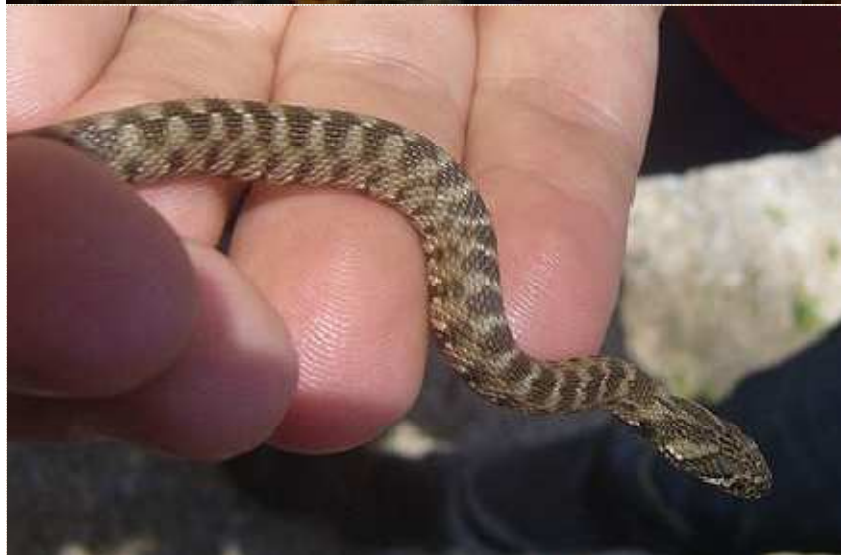
Natrix maura Culebra viperina Cobra de auga

Se non es un especialista en réptiles non debes tocar nin molestar a ningún. Os especialistas chámanse herpetólogos